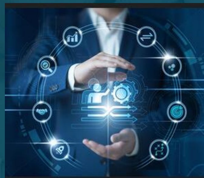
AGILITE & ADAPTABILITE