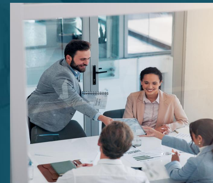
RESPECT & ENGAGEMENT