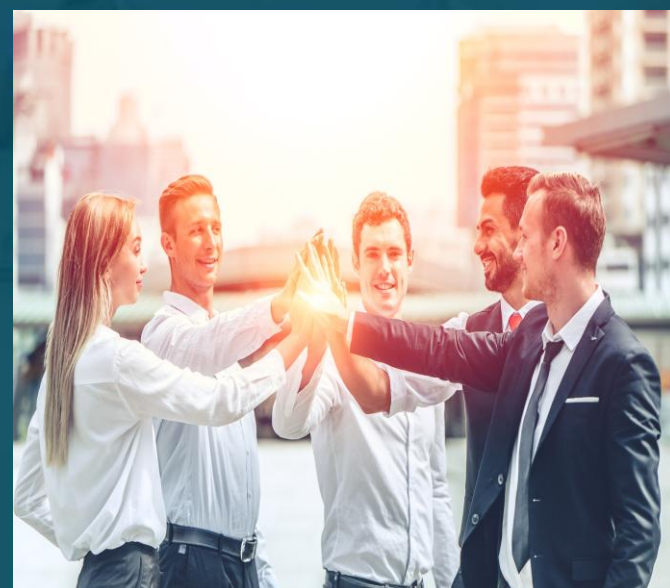
COHESION & ESPRIT D'ÉQUIPE